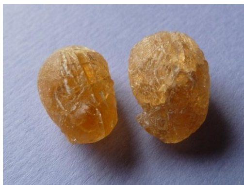
Obrázek 2: Mastix