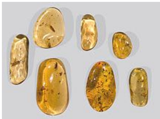
Obrázek 6: Kopály