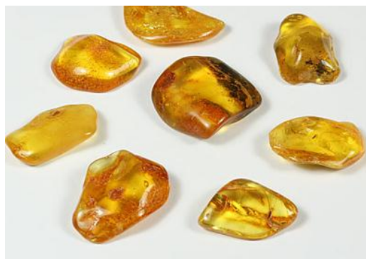
Obrázek 7: Jantary