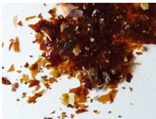
Obrázek 3: Šelak