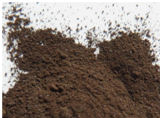
Obrázek 8: Syrský asfalt