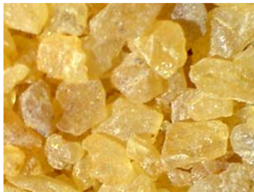
Obrázek 5: Sandarak