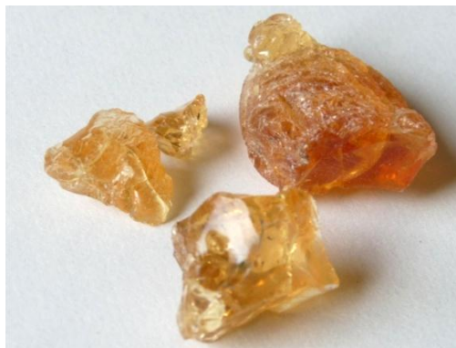
Obrázek 9: Arabská guma