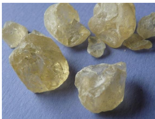
Obrázek 1: Damara