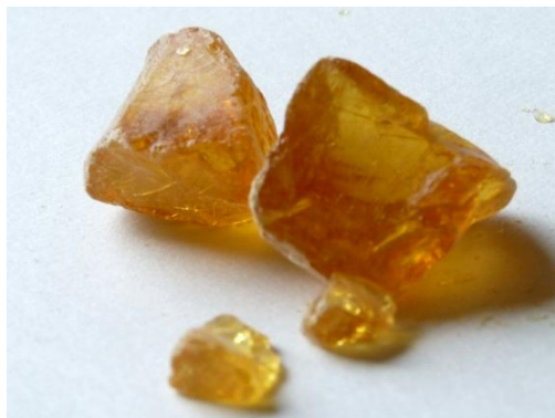
Obrázek 4: Kalafuna