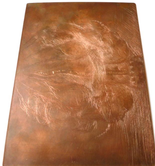
Obrázek 2: Měděná deska

Načervenalý kov s bodem tání 1083°C. Je po stříbře nejlepším vodičem elektřiny a tepla. Leptá se chloridem železitým nebo kyselinou dusičnou. Na čistém, a to i vlhkém vzduchu, je velmi stálá. Teprve po delší době se pokrývá povlakem kyslíčnicku měděného (oxiduje). Dostává pak známou zelenou patinu.