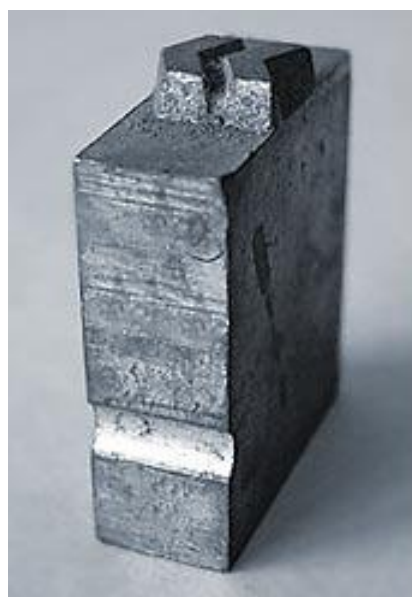
Obrázek 4: Olověná kuželka

Používá se k elektrolytickému pokovování jiných kovů, kterým