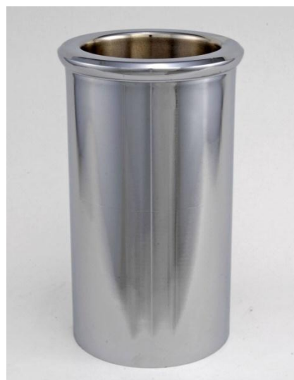
Obrázek 5: Chrom