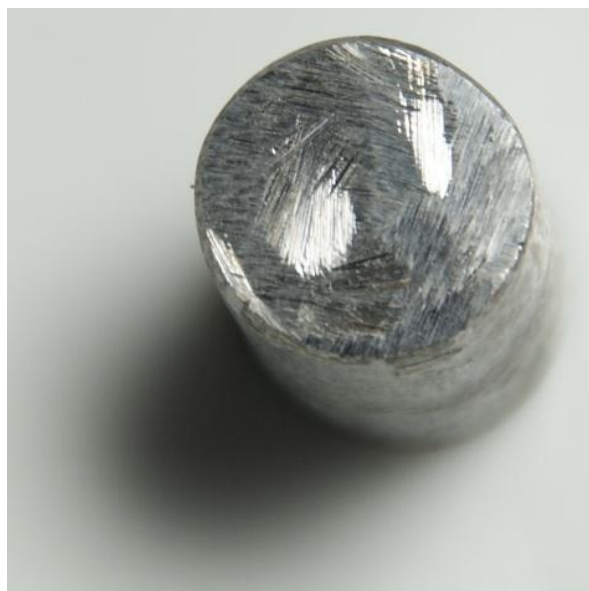
Obrázek 1: Železo