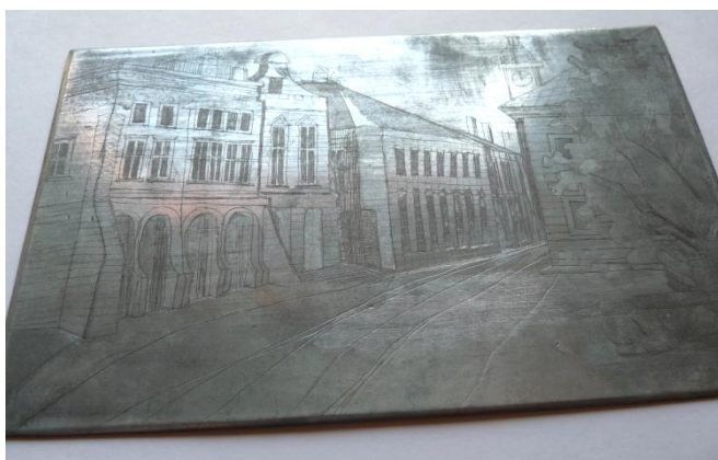
Obrázek 3: Zinková deska

Bílý kov s namodralým leskem. Na vzduchu se pokrývá vrstvou uhličitanu zinečnatého (oxiduje) – vrstva jej pak